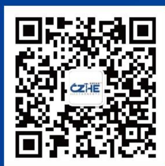
郑州五金展 官方公众号