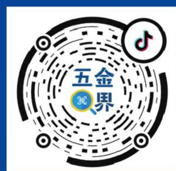
郑州五金展 官方抖音号