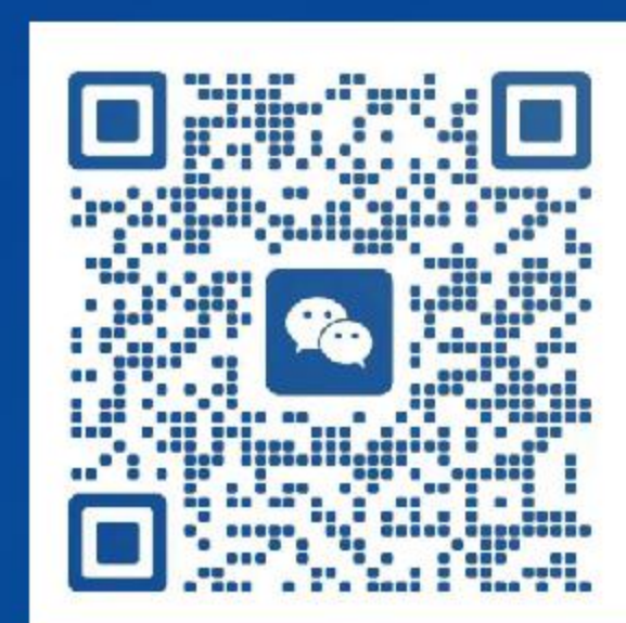
郑州五金展 官方客服号