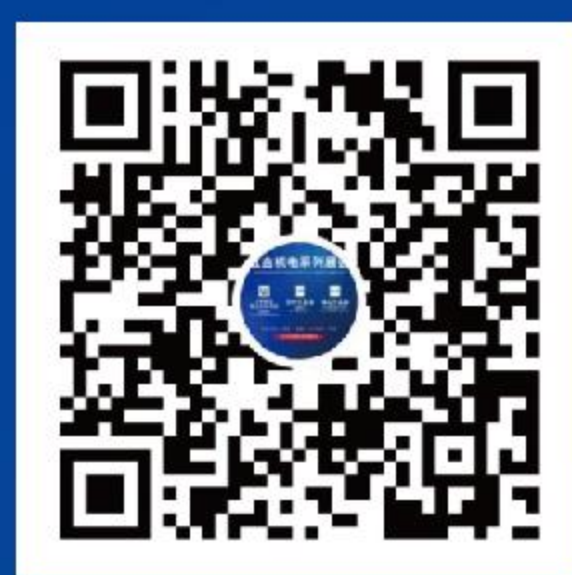
郑州五金展 官方视频号